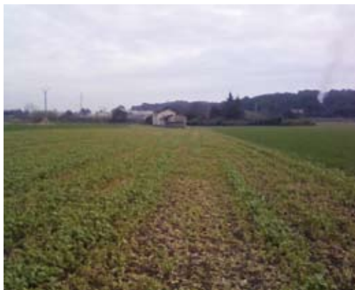
Semis du 5 octobre 2009

Ces deux photos montrent des semis de moutarde brune en plein champ, réalisés dans le secteur de Bollène, dans les Bouches-du-Rhône. Sur la première photo, les semis ont été réalisés au 5/10/2009. Sur la deuxième, ils ont été réalisés au 15/10/2009. Mi-avril, à la date prévue de broyage, les semis du 5/10 victimes du gel ne donnent pas les résultats escomptés.