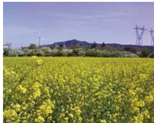
Semis du 15 octobre 2009

« La moutarde brune est la moutarde condimentaire utilisée dans la moutarde de Dijon. C'est normalement une culture de plein champ. Pour autant, elle peut être très sensible au gel après montaison, même sous abri. Il faut donc absolument que la moutarde passe l'hiver au stade rosette ».